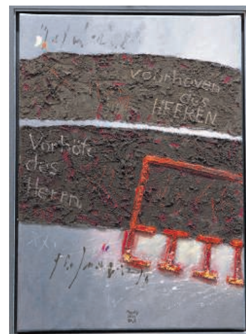
Psalm 84:3 – „voorhoven” in aarde uit Putten (boven) en Ladelund (onder).

De schilderijen zijn deze week te bezichtigen in het gemeentehuis van Putten, Fontanusplein 1, vanavond van 19.30 tot 21.30 uur, morgen van 20.00 tot 21.30 uur (na de jaarlijkse razziaherdenking) en vrijdag van 9.00 tot 12.30 uur.