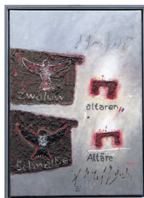
Psalm 84:4 – een zwaluw, haar jongen en de altaren symboliseren het sterke verlangen naar de geboortegrond.