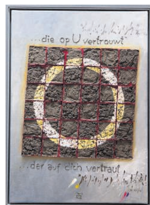
Psalm 84:13 – „...die op U vertrouwt”.