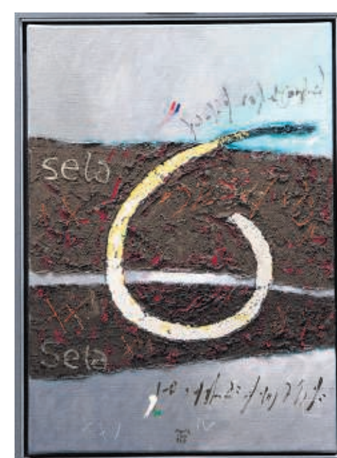
Psalm 84:9 – sela.