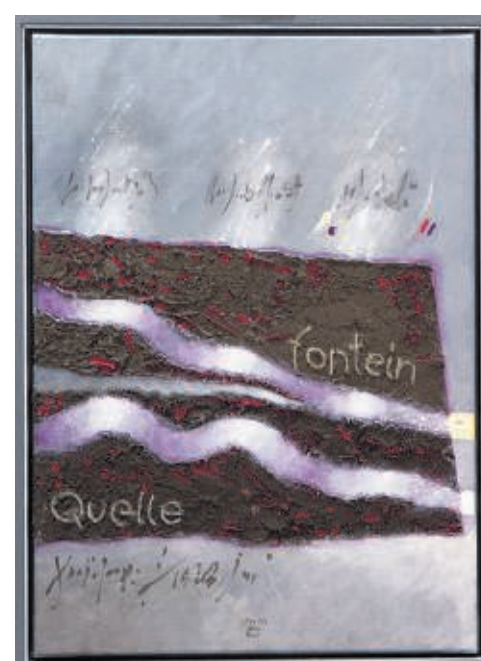
Psalm 84:7 – „fontein” en „Quelle”.